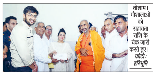
तोशाम। गोशालाओं को सहायता राशि के चेक जारी करते हुए।