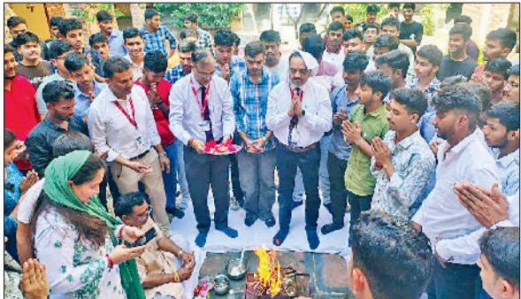
बहल। बीआरसीएम कॉलेज में आयोजित कार्यक्रम में हवन में पूर्णाहुति देते हुए स्टाफ सदस्य व विद्यार्थी।