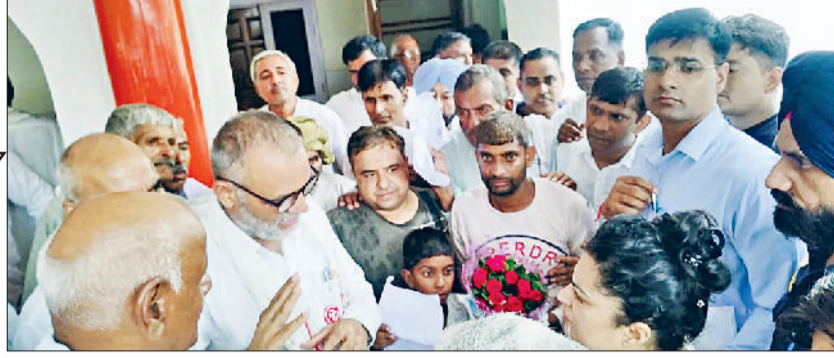
भिवानी। सिंचाई मंत्री से घग्गर ड्रेन की पटरियों को मजबूत करने की मांग करते हुए।

मिवानी घग्गर ड्रेन में बापोड़ा में दो ड्रेन तालू सिवाड़ा मण्डाना तथा धनाना सैमण ड्रेन मिलती हैं, कई गांवों का पानी आ मिला