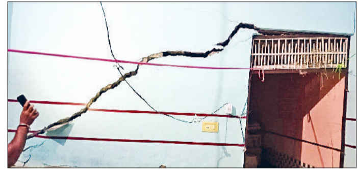
भिवानी। बारिश के पानी जमा होने के बाद मकान में आई दरार का दृश्य।

का पानी जमा है। पार्क की दिवारों में भी दरारें आने लगी हैं। इनके साथ लगते मकानों में तीन से चार फुट पानी है। लोगों के घर के अंदर तक पानी पहुंचने की वजह से वे बार बार पानी को बाल्टियों में भरकर बाहर फेंक रहे हैं। कई मकान मालिकों ने अंदर पानी को निकालने के लिए पम्पसेट लगाने शुरू कर दिए, लेकिन जितना पानी निकाला जा रहा है। उतना ही पानी बह भी रहा है। पानी ज्यादा होने की वजह से कई परिवारों ने मकानों को खाली करके अन्य मकानों में शरण लेनी आरंभ कर दी है। वहीं जिस इलाके में पानी जमा है। उस इलाके के मकानों में दरारें आ गई हैं। मकान के फर्श भी बैठने लगे हैं। जो कि ये मकान कभी भी धंस कर बड़े हादसे का कारण बन सकते हैं। मकान के जिस हिस्से में दरार आ गई है। उन कमरों को छोड़ दिया है।