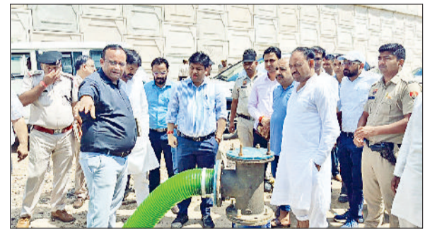
बवानीखेड़ा। पानी की निकासी का जायजा लेते विधायक।