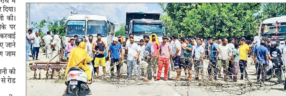
भिवानी। पानी की निकासी नहीं होने से नाराज लोग लकड़ी पत्थर लगाकर वाहनों को रोकते ग्रामीण।

सदर थाना की पुलिस ने मौके पर पहुंचकर प्रदर्शनकारियों की अधिकारियों से बातचीत करवाई और जल्द ही पानी की निकासी करवाए जाने का भरोसा दिलाया। तब जाकर ग्रामीण जाम हटाने को राजी हुए।