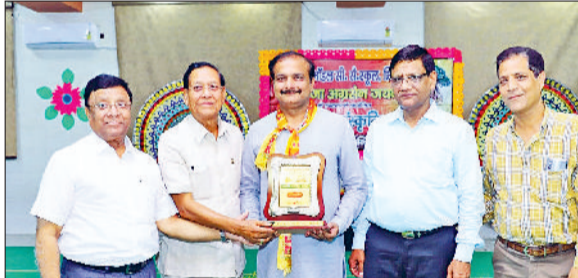
भिवानी। कार्यक्रम में सम्मानित करते हुए।