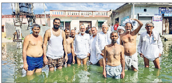
बाढ़ड़ा। पानी की निकासी की मांग को लेकर नारेबाजी करते हुए।