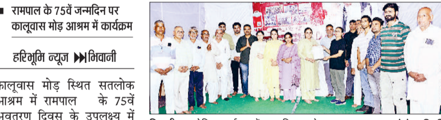
भिवानी। आयोजित कार्यक्रम में सम्मानित करते हुए।