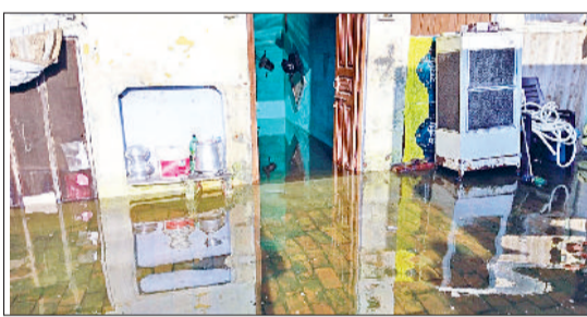
भिवानी। एक घर के अंदर घुसा पानी का दृश्य और घर के भीतर जमा बारिश का पानी।